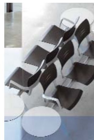
Bancada con tres asientos y mesas en los extremos.

Los elementos metálicos de la bancada se pintan con pintura epoxi en polvo. Con un espesor mínimo de 60 micras.