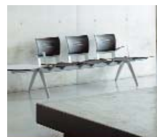
Bancada con tres asientos y mesas en los extremos.