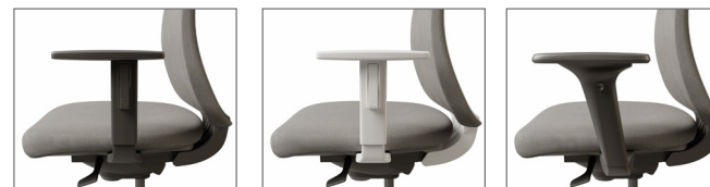
▲ ACCOUDOIRS 1D, NE ou BA