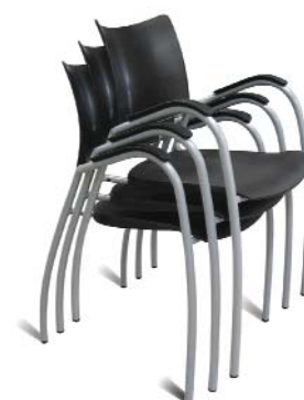
Siège visiteur 4 pieds

Le dossier est fixé à la structure en aluminium par un système de queues d'aronde.