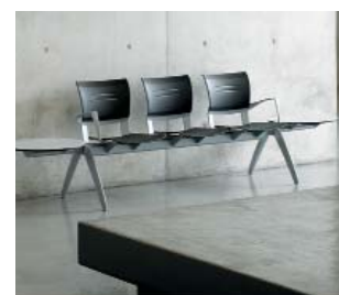
Banquette avec 3 assises et table dans les cotés