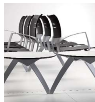
Banquette avec 3 assises et table dans les cotés